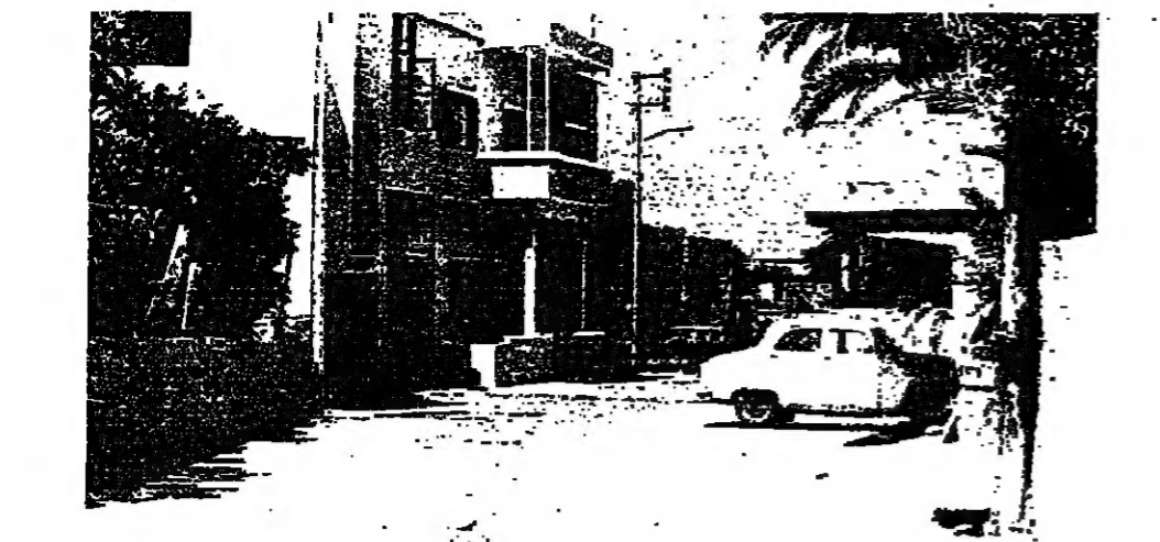
المنازل حنينا وتندما محاوران

والعرض للتسليم السابق ميشال سكاف أسعار الكلفة التي يتكدها الكراميون وطالب بزيادة الأسعار هذه السنة ، كما يتكدها من العمل في السنة التي ، ودعا الى التماثل بين الكرامين واصحاب المعامل ، والا وجد الكراميون أنفسهم مضطرين لفتح تصريف الكرمية ، والإجلاء الى قطاع زراعي آخر . وتكلم هذا المحافظ وحث على الاتفاق لتلافي الضرر الذي يهدد اهم عنصر اقتصادي لا يوجد الا قسري الفتح . واعرب القرو سكاف عن مخاوفه من التراض هذه الزراعة وطالب بالالتصاف على سعر عادل للجميع . تحكيم المستحقة الا ان مساره رفض رفع السعر ، وقال بان الحكم في الموضوع هو المحسنة ، الذي اعتمد على زيادة ٢٥ ٪ بعد الأحداث ، وهو يرفض اليوم أية زيادة جديدة بالاستمرار واقترح كحل للتراض على الخسارة في التصرف اذا كانت زيادة الأسعار . وفي النهاية طلب المحافظ من الجميع ان يتوصلوا الى حل وسط بين المسرين ( . . . ) سعر المعامل ٨٠٠ تصفية الكرامين ، ولكن السيد مساره رفض التزام بأي سعر فوق الخمسين ترشا ، قبل العودة الى مجلس ادارة شركته ، وإلى اصحاب المعامل والتي اجتمعوا بعد الاتفاق على اي شيء بعض بوسر المنب هذه السنة .